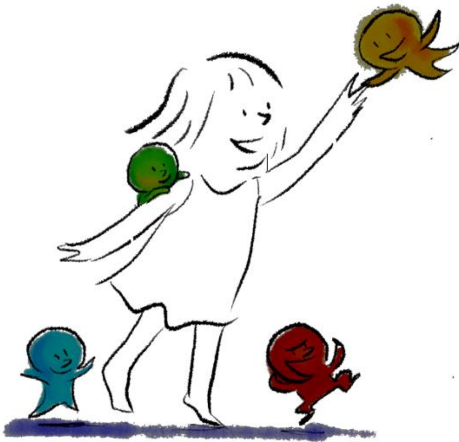
Illustration de Béatrice Rodriguez

Nouvelle de Marie Vallaude D'après une idée originale de Marie-Julie de Coligny